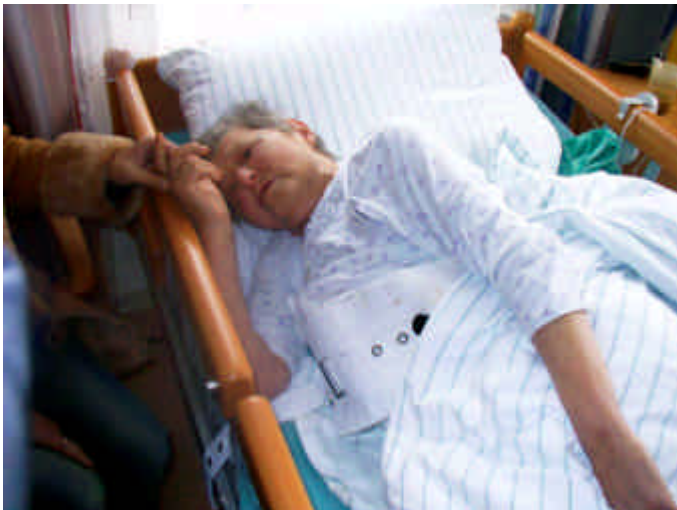
Ende Sept. 2004

Die ganze Zeit über sei die Großmutter kaum richtig wach gewesen, dennoch wurde sie im Heim, zusätzlich zu den Gittern am Bett, noch mit einem Bauchgurt fixiert.