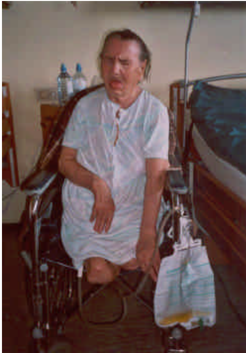
Foto/Folie 8: Das Foto zeigt Frau B nach der Amputation im Rollstuhl. Ein Bild, das Bände spricht!

Nach mehreren chirurgischen Abtragungen von Nekrosen an den Füßen und der akuten Gefahr einer Sepsis wurden ihr im Juli und August 2002 beide Beine bis zu den Oberschenkeln amputiert.